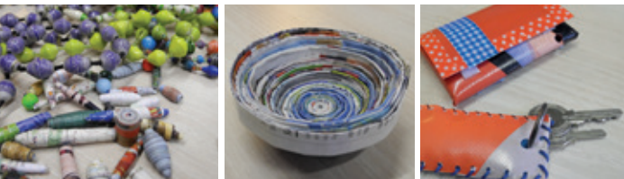
Papierperlen: 7-10 Jahre; Papierschalen: 9-13 Jahre; PVC Schlüsselanhänger: 10-13 Jahre und PVC Geldbeutel: 8-13 Jahre

Du erfährst zusammen mit deinen Geburtstagsgästen, wie und wo euch der Regenwald im Alltag begegnet. Im Anschluss stellt ihr aus altem Papier oder PVC Planen neue kreative Gegenstände her. Entscheide dich vorab, ob du einen Schlüsselanhänger, einen Geldbeutel, Papierperlen oder eine Papierschale basteln möchtest!